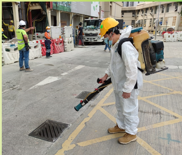
工程承辦商聘請專業人士，定期在工地附近噴灑滅蚊油。

夏天已經到臨，天氣反覆不定，時晴時雨。鑑於工程仍未完成，如遇大雨，新大樓室內部份有機會出現積水，從而滋生蚊蟲；另一方面，現時工地每日有過百名工作人員出入，無可避免產生一定數量的垃圾，包括殘留食物。針對上述情況，我們持續督促承辦商必須妥善清理積水及收集垃圾等，以截斷蚊蟲滋生的機會。食物環境衛生署近日也派員前往巡視，並就如何維持工地環境衛生，給予不少寶貴的意見。