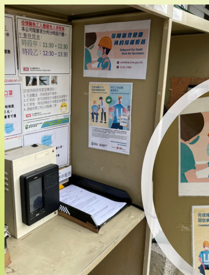
工地張貼了海報，呼籲工作人員接種新冠疫苗。

除了從根源著手處理蚊蟲問題，承辦商也會邀請專業滅蟲公司到場噴灑滅蚊油及放置防蚊沙等，次數為每星期兩次；如有需要的話，更可增加相關次數。