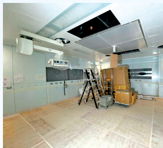
個別樓層的手術室已經完成組裝。

優化設施 提升服務 Enhancing Facilities Improving Services