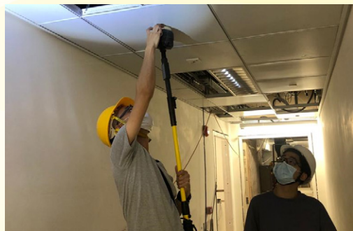
Fire service facilities testing.

As reported in the previous new OT Block newsletters, the new operating theatres will be located on 2/F, 4/F and 6/F. The prototype installation of wall panels, vinyl floors, ceiling and metal studs are in progress. As the new delivery suites on 9/F will be the first batch of facilities to commence service in the new OT Block, workers are now conducting renovation works in full speed in order to prepare for equipment and furniture installation as soon as possible.