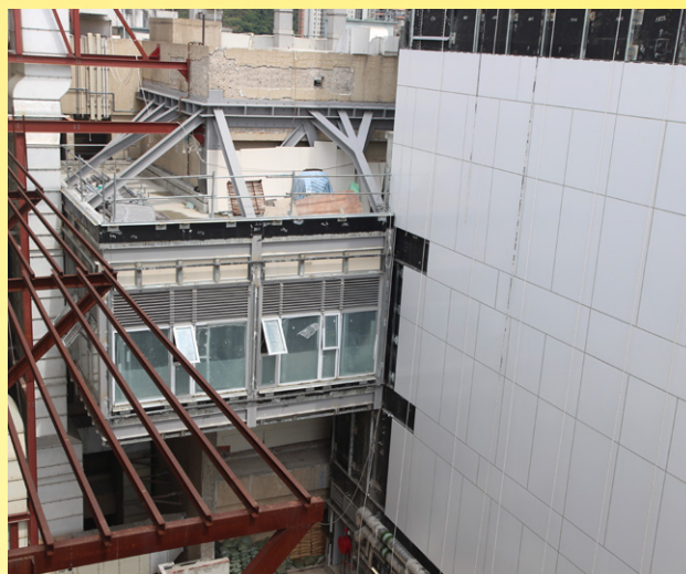
Linkage between existing and new OT Block.

To ensure sustainability and reduce environmental impacts, our new OT Block adopted many green building characteristics and design. First, the building materials are of low thermal conductivity with good thermal insulation resulting in the reduction of overall building energy consumption. On the other hand, the concept of building envelope also helps to reduce noise transmission.