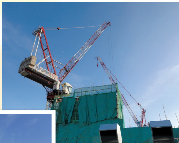
兩座天秤共同豎立在工地的情景將不復見。

窗戶及外牆鋁板現時正陸續在各個樓層安裝，進展良好，稍後便會開展下一個工序一拆卸棚架；當全部棚架拆去後，便可更清晰地看到整幢新手術室大樓的外觀。