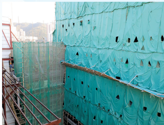
新舊大樓在九樓會有一條新興建的天橋連接起來。