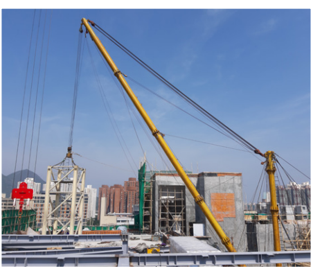
圖為早前安裝新天秤的情況。