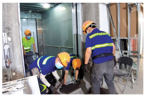
新大樓的升降機正在測試中，稍後便可正式使用。