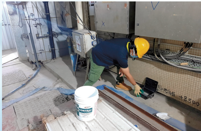
承建商在工地範圍擺放老鼠藥餌，杜絕鼠患。

由於目前的施工工序集中在室內，加上工地存放了不少建築材料，容易衍生環境衛生問題。承建商現時會每星期兩次安排專業人員到場，協助擺放鼠餌和捕鼠器等。我們則與食物環境衛生署保持緊密聯繫，就如何保持醫院整體環境衛生，以及加強滅鼠工作等，交流意見。