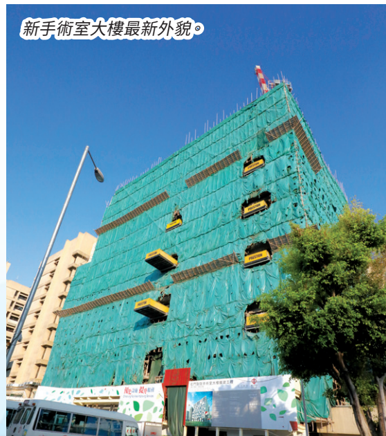
新手術室大樓最新外貌。

在今年上半年，我們率先處理及完成地庫工程，目的是讓電力公司在有關樓層安裝變壓器及發電設施。有關安裝早前已經完成，我們正與電力公司安排接駁工程，之後便可為新手術室大樓正式供電。另一方面，大樓內其中四部升降機也完成安裝，現時正進行測試，待機電工程署檢查後，就可開放給工友使用。此舉有助減少他們經醫院主座大樓出入，因該處設有病房，有不少醫護人員及病人經過；在疫情下，分流工友使用新升降機，可以減少人群聚集帶來的風險。