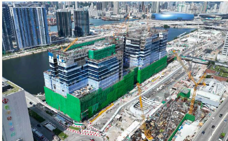
腫瘤科大樓和專科門診大樓