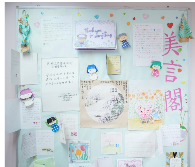
許多患者對血液科癌症個案經理的專業和無微不至表示衷心讚賞。

血 液癌症包括淋巴瘤、急性血癌及多發性骨髓瘤，其中淋巴瘤更是香港十大常見癌症之一。血液癌症近年逐漸年輕化，而相關治療方案更超過100種組合，令其治療比其他癌症更為複雜。屯門醫院於2021年推出「癌症個案經理」計劃，安排專責的資深護師陪伴患者，幫助他們渡過艱辛的抗癌旅程。