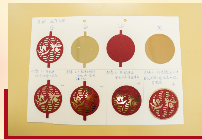
每件工藝品都是復元人士用心雕琢的成果。圖為他們剪紙的模版。