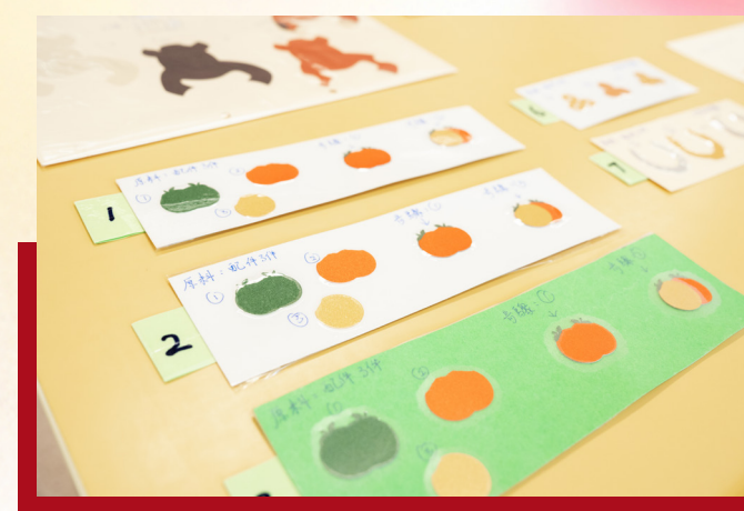
製作每一個式樣的工藝品，都需要先訂模版，並標上製作原料。