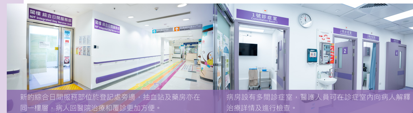
新的綜合日間服務部位於登記處旁邊，抽血站及藥房亦在同一樓層，病人回醫院治療和覆診更加方便。