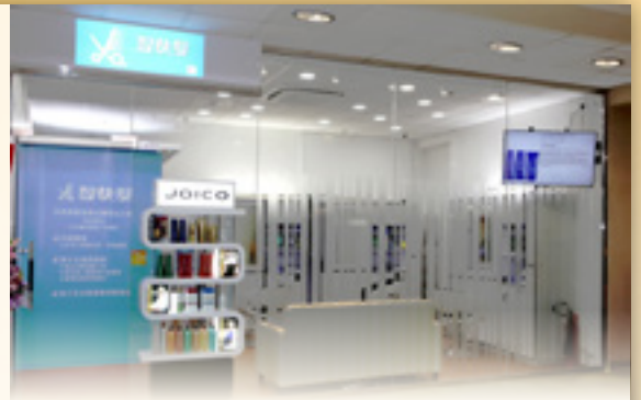
於屯門醫院經營的社企理髮店

作為公營機構，醫管局十分支持社會企業的發展，故此屯門醫院不少店鋪都是由社企營運，比例更是全港公立醫院數一數二。