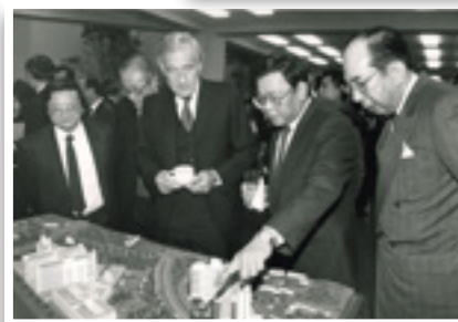
當年港督衛奕信爵士出席屯門醫院開幕禮