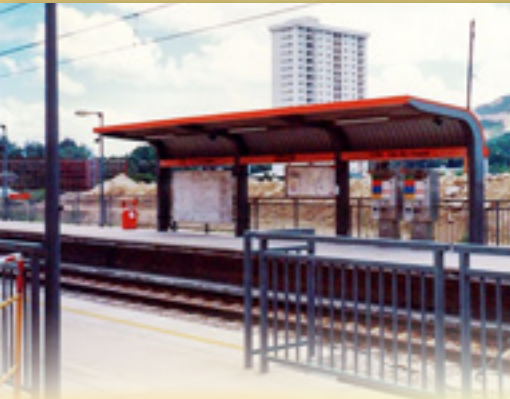
輕鐵屯門醫院站早年外貌

在八十年代或以前興建的公立醫院，絕大部份都以英國皇室的名字命名，屯門醫院是當年少數以地區名字命名的醫院，令人一聽到醫院的名稱，就知道這醫院是以屯門這個社區為本，主力服務屯門居民的地區醫院，無形中加強了屯門醫院與社區的聯繫，及後興建的多間公立醫院，不少也沿用了這種命名的方法。