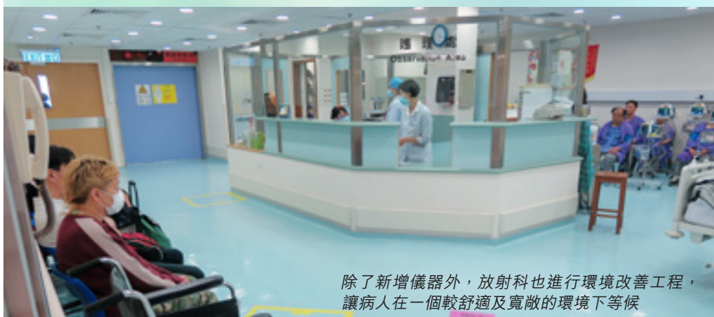
除了新增儀器外，放射科也進行環境改善工程，讓病人在一個較舒適及寬敞的環境下等候