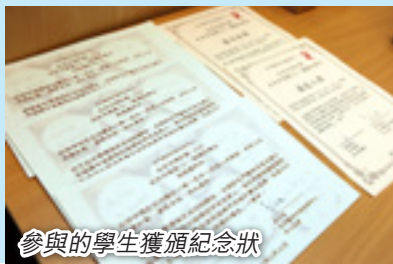
參與的學生獲頒紀念狀

活動今年已是第三年舉辦，招募了37名來自順德聯誼總會梁銶琚中學的學生與24名兒童及青年腦癇症病友，漫談面對腦癇的日子、苦與樂、生活智慧和重生故事，一一記錄在『生命共鳴集(3)腦癇的曙光』裏。