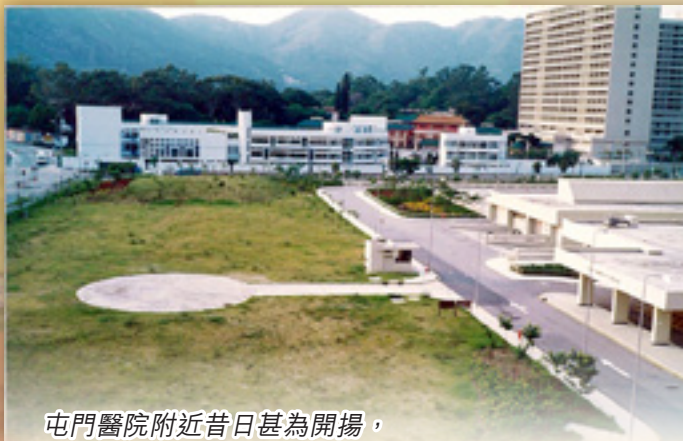
屯門醫院附近昔日甚為開揚，方便直升機降落