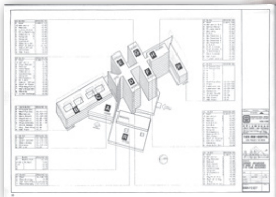
八十年代的醫院圖則

興建屯門醫院的概念早在七十年代末提出，並經歷了約十年的規劃設計及建築期；以下的相片記錄了很多屯門醫院的重要時刻，值得細味。