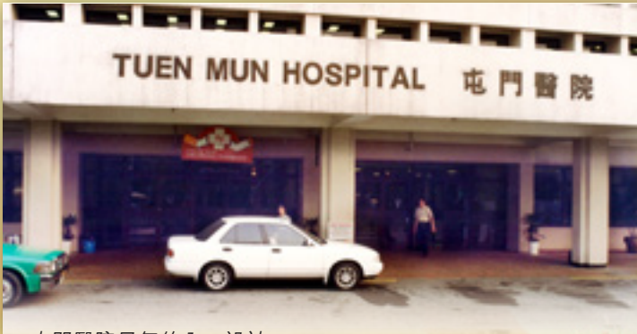
屯門醫院早年的入口設計