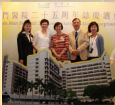
主禮嘉賓們與屯門醫院醫護人員合照