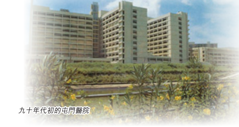
九十年代的屯門醫院