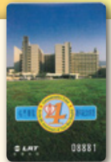
輕鐵曾經發行屯門醫院四週年紀念車票

若要前往屯門醫院，很多市民都會選擇乘搭輕鐵；而在本港眾多醫院中，只有屯門醫院擁有與其名字相同的鐵路站——屯門醫院站。輕鐵早在1988年通車，雖然當時屯門醫院仍未投入服務，但輕鐵已經預留了興建屯門醫院站的位置。為了方便病人或行動不便的人士，屯門醫院站於月台設有長椅，而北行月台更是與醫院的入口直接相連。