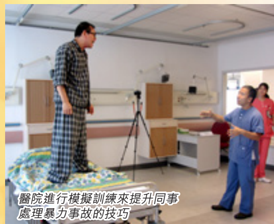
醫院進行模擬訓練來提升同事處理暴力事故的技巧

透過全方位優化方案的推行，2014/15年的急症室暴力事件與求診人數比率較2012年大幅下降35%。員工對暴力的意識及處理技巧亦得到提升。博愛醫院更憑這個方案，在2015年亞洲醫院管理大獎榮獲傑出獎(內部顧客服務改善組別)。