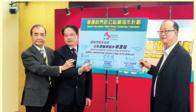
醫管局早前聯同私家醫生及病人團體 召開記者會，公佈計劃詳情

與以往類似的計劃不同，是次參加計劃的私家醫生，可以向醫管局藥物供應商以指定價格，購買包括抗高血壓藥、調節血脂藥、口服降血糖藥及抗生素等，此舉既可確保病人獲處方具質素的藥物，又可增加私家醫生參加計劃的誘因。