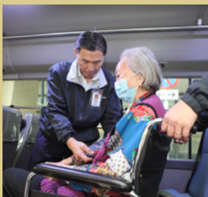
阿蘇在開車前，都會細心檢查長者是否扣上安全帶等，確保他們的安全