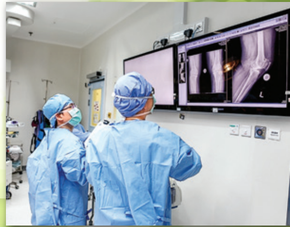
（圖一）關節置換手術過程