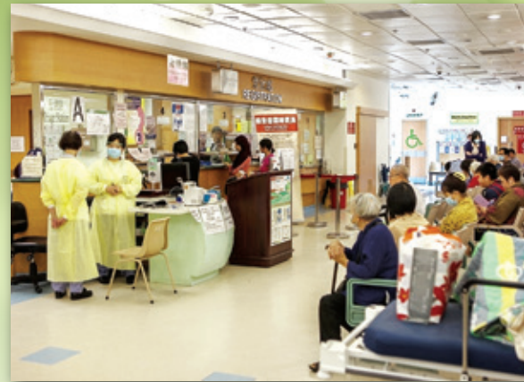
（圖二）屯門醫院急症室