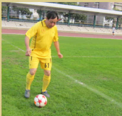
羅爺除精於攝影外，亦熱愛足球運動，現兼任聯網及醫管局足球隊領隊及教練，有「屯院費格遜」的稱譽