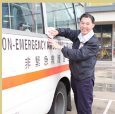
阿蘇每天都要接載長者，對區內的道路可謂瞭如指掌

阿蘇事事以長者為先，連細節也很重視。「推著坐輪椅的長者上車時，最重要是推得慢一點、平穩一點，等他們坐得舒服。」返回日間醫院時，阿蘇也會協助護理人員照顧長者，閒時又會與他們談天說地，漸漸建立起友誼。有些長者見到阿蘇時會問：「幾時再可以坐你車呀？」有時候在街上碰到一些康復的長者，大家亦會互相問好。這些工作上的點點滴滴，便成為了阿蘇工作的最大推動力。