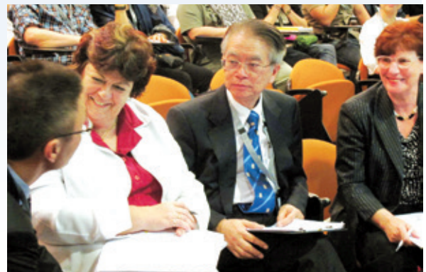
澳洲醫療服務標準委員會成員前往青山醫院進行評估及交流意見

有鑑於精神科的服務模式與一般全科醫院有異，加上青山醫院是本港首間進行認證的精神科醫院，醫院各職系同事花了不少時間，檢視多項服務標準。評審機構在今年5月提供了分析報告，肯定了醫院的表現之餘，也提出了一些改善建議。青山醫院將在未來一年積極跟進，目標是為病人提供更趨完善的精神科醫療服務。