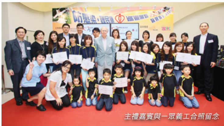
主禮嘉賓與一眾義工合照留念