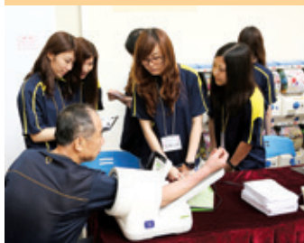
義工為市民免費量度血壓

今年7月20日，新界西醫院聯網於於天水圍天耀廣場舉行展覽啓動禮，邀請了元朗區議會、屯門民政事務處及衛生署的代表，聯同本聯網總監一起簽署衛生約章，承諾為保持社區衛生共同合作，攜手保障市民健康。活動當日，聯網安排了兩場衛生講座，分別向市民講解洗手的步驟，以及夏天傳染病的資訊，亦設置了攤位，義務為區內市民量度血壓、體質指標及提供健康諮詢服務。現場並設有問答遊戲，既提高市民衛生意識，又送出紀念品，務求與眾同樂。