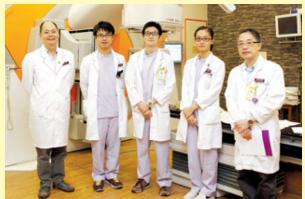
操作儀器的「幕後主腦」— 放射治療師

整體而言，這先進儀器能讓醫療人員更準確地治療癌腫瘤，病人的痊癒率及治療後的生活質素也會相應提高，對病人確是一大福音。