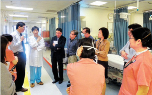
醫院質素及安全部前往博愛醫院急症室進行評估

醫院管理局自2009年起開展醫院認證計劃，新界西醫院聯網一直積極參與，希望藉此檢視及改善工作流程、醫院設施、環境、相關規則及指引等，以提升整體服務水平。