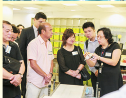
就2013/14年度工作計劃，聯網安排了新聞發布會及參觀活動，邀請傳媒和元朗區議員到博愛醫院參觀最新的水療服務及藥房。