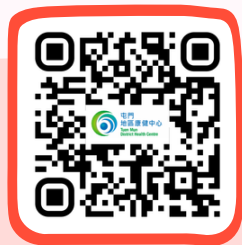
屯門地區康健中心 Tuen Mun District Health Centre