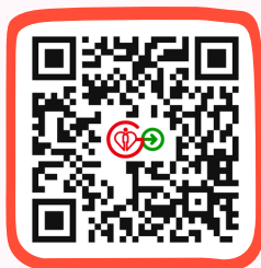
HA Go 網站 HA Go Website