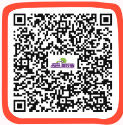
風濕性關節炎資訊 Rheumatoid Arthritis Information