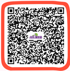
老年人髖關節骨折資訊 Geriatric Hip Fracture Information