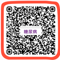
糖尿病資訊 Diabetes Mellitus Information