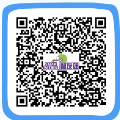
直腸癌資訊 Colorectal Cancer Information