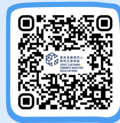
藥健同心博愛醫院社區藥房 PHARM+ Pok Oi Hospital Community Pharmacy