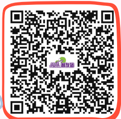
白內障資訊 Cataract Information