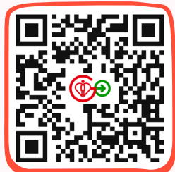
HA Go 網站 HA Go Website