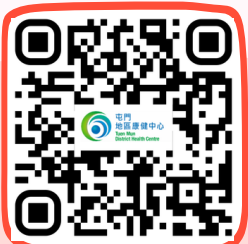
屯門地區康健中心 Tuen Mun District Health Centre