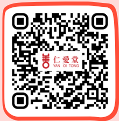
仁愛堂鄭丁港善心藥物中心 Yan Oi Tong Community Pharmacy