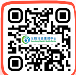
元朗地區康健中心 Yuen Long District Health Centre