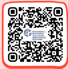
藥健同心博愛醫院社區藥房 PHARM+ Pok Oi Hospital Community Pharmacy