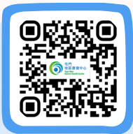
屯門地區康健中心 Tuen Mun District Health Centre