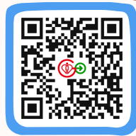
HA Go 網站 HA Go Website