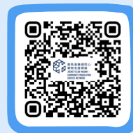
藥健同心 博愛醫院社區藥房 PHARM+ Pok Oi Hospital Community Pharmacy