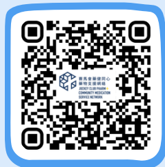
藥健同心博愛醫院社區藥房 PHARM+ Pok Oi Hospital Community Pharmacy