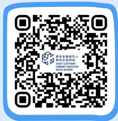
藥健同心博愛醫院社區藥房 PHARM+ Pok Oi Hospital Community Pharmacy