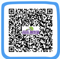
膀胱癌資訊 Bladder Cancer Information