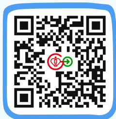
HA Go 網站 HA Go Website