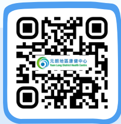
元朗地區康健中心 Yuen Long District Health Centre