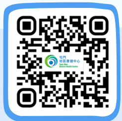
屯門地區康健中心 Tuen Mun District Health Centre