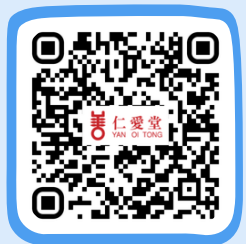
仁愛堂鄭丁港善心藥物中心 Yan Oi Tong Community Pharmacy