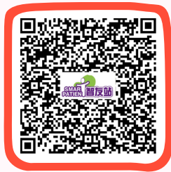
老年黃斑病變資訊 ARMD Information