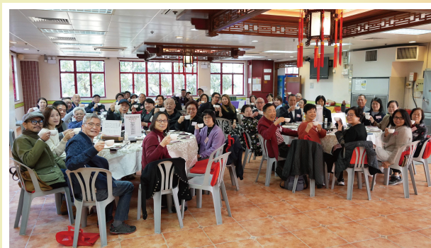
感謝善長們的支持，基金特設鳴謝午宴聊表心意。

為向一眾無私奉獻的善長表達誠摯謝意，基金於2026年2月2日中午假蓬瀛仙館舉行「善長鳴謝午宴」，邀請了大額捐款善長，以及曾參與以往「新春勝意燈競投」的善長出席，享用精美齋宴。