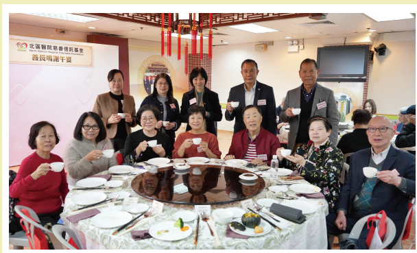
善長們的支持，是基金發展的一大動力。

是次午宴不僅讓善長們聚首一堂，加深了社區各界的慈善脈絡，更是對他們無私奉獻的鼓舞肯定。展望未來，基金將繼續用每一分捐款於北區醫院臨床服務與病人福利上，提升服務質素，同時加強醫護人員培訓，並深入社區推廣健康教育，實踐「醫社同行」的宗旨。