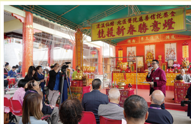
知名司儀與在場善長交流互動，將氣氛推至高峰。

當日活動競投氣氛熾熱，善長們為奪得心水勝意燈踴躍舉牌，仙館特邀知名司儀與在場善長交流互動，將氣氛推至高峰，更有善長即場「加碼」捐出香油金，使善款更上一層樓，打破多年來的紀錄。