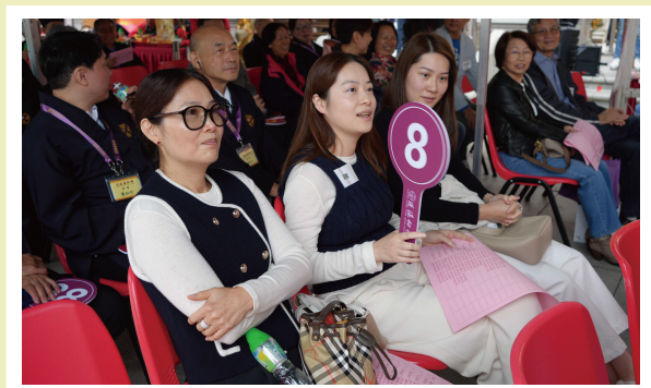
善長們為奪得心水勝意燈踴躍舉牌。

蓬瀛仙館每年均舉辦「新春勝意燈競投」為北區醫院慈善信託基金籌款，今年（丙午馬年）競投活動已於2026年3月1日（農曆正月十三日）圓滿舉行，承蒙仙館及眾多善長的鼎力支持，新春勝意燈競投活動連同當日義賣亭收益，為基金籌得超過二百萬港元善款，刷新歷年紀錄。