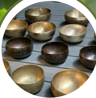
聆聽頌鉢 放鬆心情