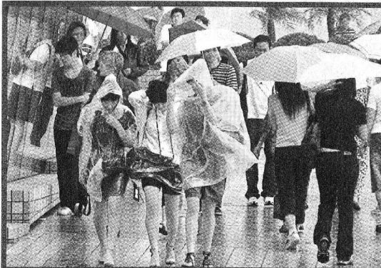
■北冕襲港，市民難得有一日假期，風雨下也要上街。