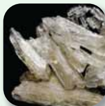
(上圖為實物的放大圖)

為解離性麻醉藥，現存醫學用途主要是動物手術或戰場之中。絕大部分人濫用K仔的方法都是「索K」，即是將K粉直接吸進鼻裏，透過鼻孔內微絲血管吸收，然後運行上腦產生反應。濫用者形容「索K」後會感覺到自己好像脫離現實世界，外間的環境和人物會變得遙遠而不真實，進入一種近似「靈魂出竅」的現象。K仔雖沒有明顯的脫癮反應，但產生的心癮極快極強，短時間內令人沉迷，完全成為K仔的奴隸。