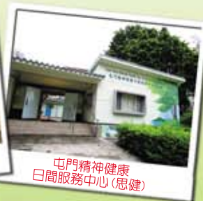
屯門精神健康 日間服務中心(思健)