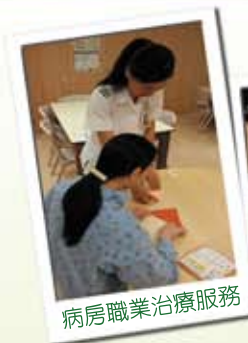
病房職業治療服務