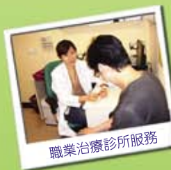
職業治療診所服務