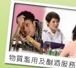
物質濫用及酗酒服務