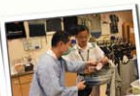
中央職業治療服務