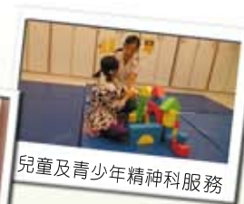
兒童及青少年精神科服務