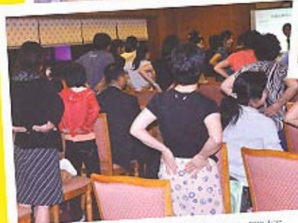
鄧肇堅醫院中醫藥中心醫師 中醫穴位保健按摩和流行性感冒的中醫防治