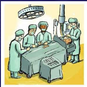
Same Procedure Theatre