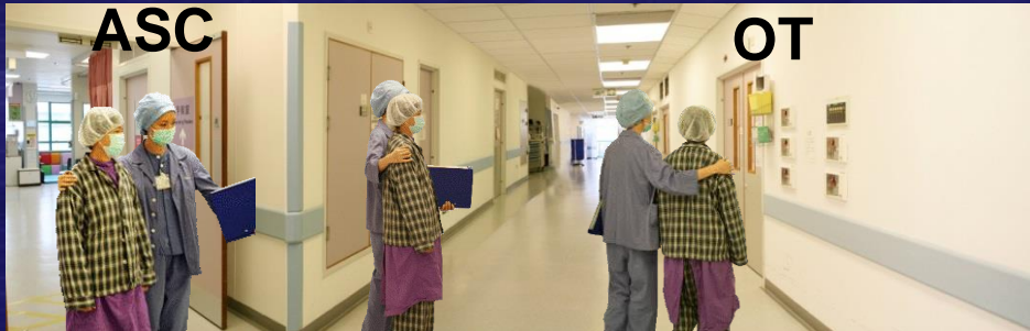
Modified Patient Flow