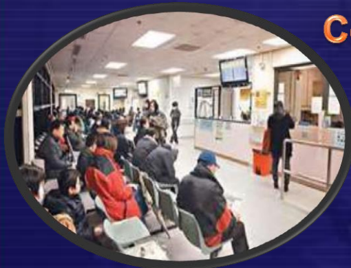
Specialist Outpatient Clinic