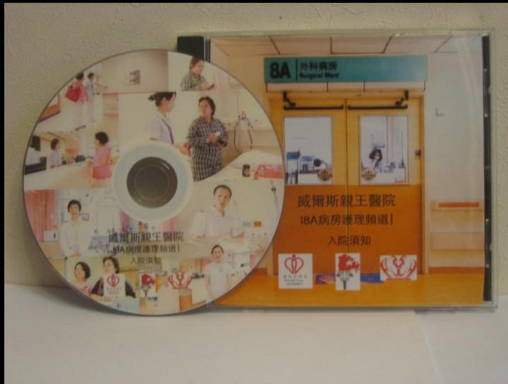
Stable and clinical admitted patient